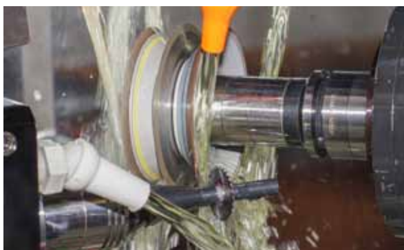
Notre service de réaffûtage pour les exigences les plus élevées.