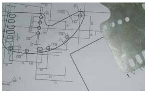
Conseil personnalisé, jusque dans le plus petit détail.

Notre entreprise peut se prévaloir de plusieurs décennies d'expérience dans le trempage de sous traitance, la trempe sous vide et le traitement thermique d'aciers hautement alliés dans notre four continu. Le traitement thermique dans un four sous vide est un procédé non seulement respectueux de l'environnement, mais également de très haute précision, grâce aux processus de fabrication automatisés.